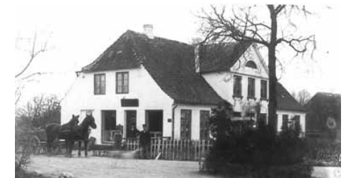
Købmanden på Diernæsvej.