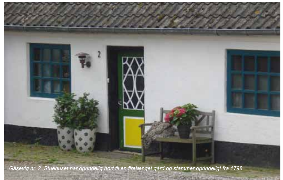
Gåsevig nr. 2. Stuehuset har oprindeligt hørt til en firelænget gård og stammer oprindeligt fra 1798.