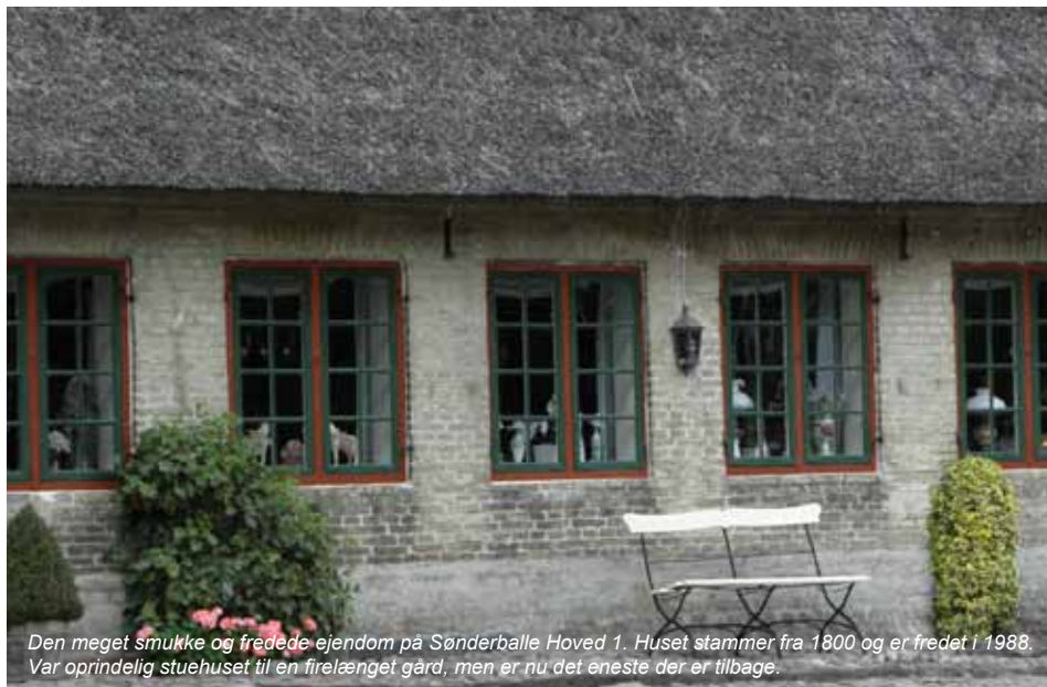
Den meget smukke og fredede ejendom på Sønderballe Hoved 1. Huset stammer fra 1800 og er fredet i 1988. Var oprindeligt stuehuset til en firelænget gård, men er nu det eneste der er tilbage.