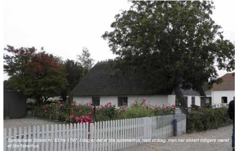
Sønderballe Strand nr. 83 fra 1797. I dag er det et lille sommerhus med stråtag, men har sikkert tidligere været et lille fiskerhus.