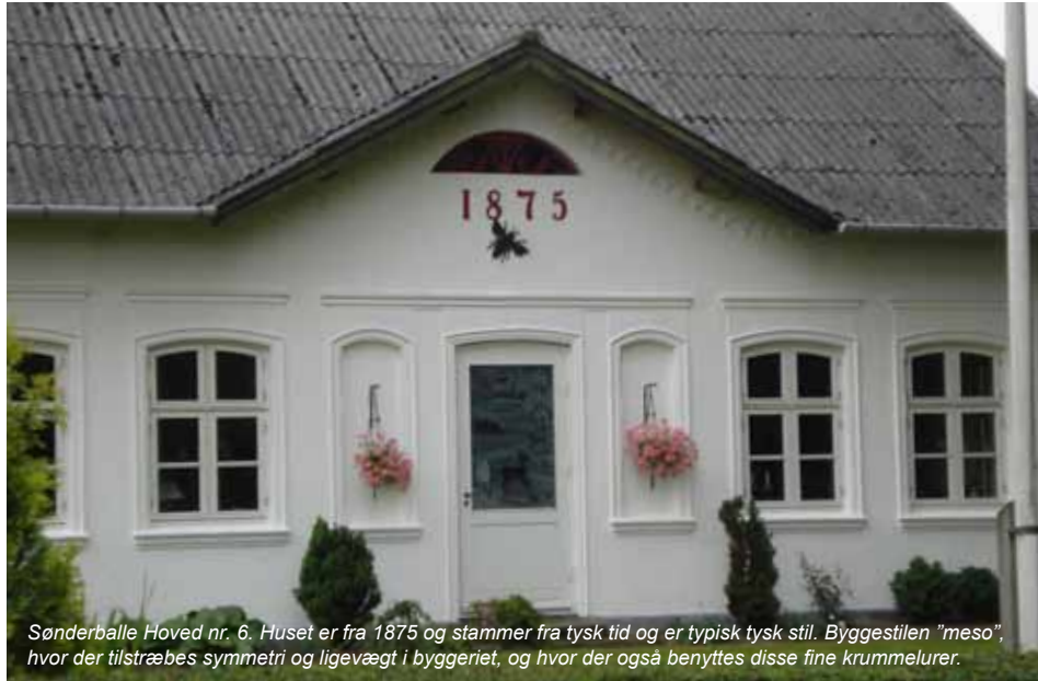
Sønderballe Hoved nr. 6. Huset er fra 1875 og stammer fra tysk tid og er typisk tysk stil. Byggestilen "meso", hvor der tilstræbes symmetri og ligevægt i byggeriet, og hvor der også benyttes disse fine krummelurer.