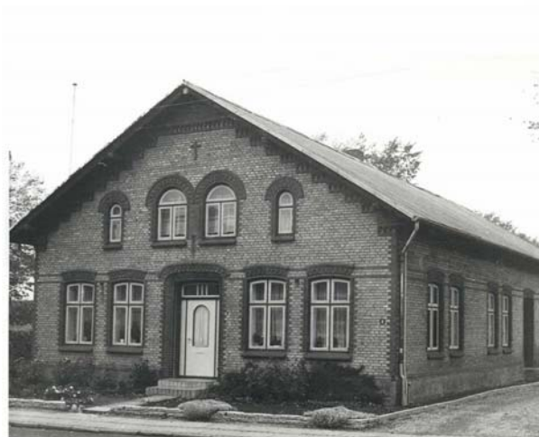
Typisk ejendom i schweizerstil eller "Gewerkhulen-stil". Boldervej ved Aabenraa, ca. 1900.