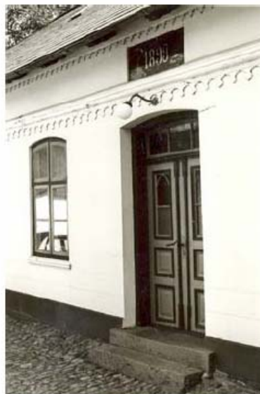
Stuehus med skifertag og træmpel. Kiplevej 1893.