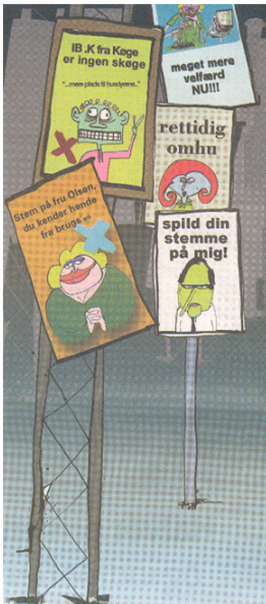
Illustration: Jenz Koudahl/Spild af tid

Det er således mangel på respekt for dags virkelighed og historien, når man på en tysk mindretals valgplakat skriver "stem sønderjysk". En sønderjyde er en dansker, sådan er den historiske virkelighed.