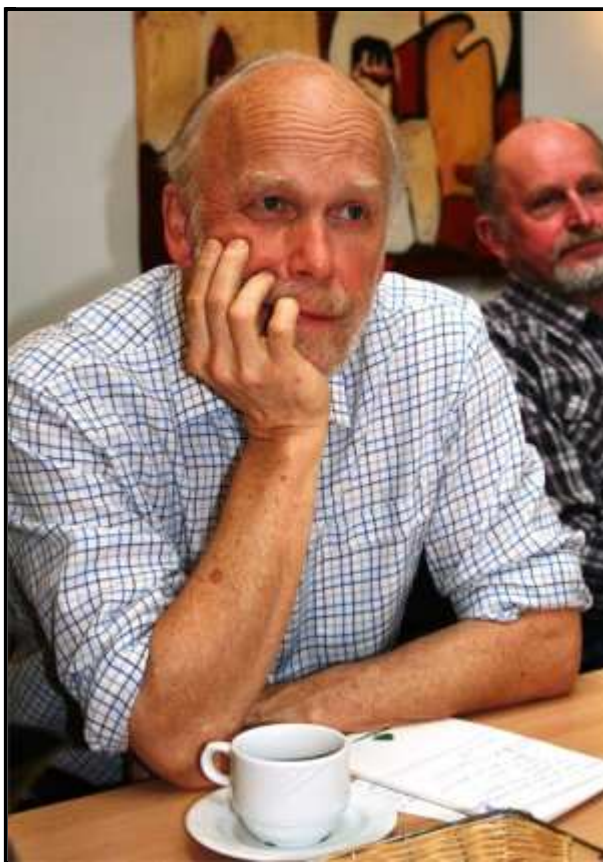
”Sønderballe Ejerlavs Beboerforening i tænkeboksen”

Der vil blive udarbejdet en rapport over arbejdet i ”Netværkslejren”, som vil blive tilgængelig på Haderslev Kommunes hjemmeside; - herom senere.