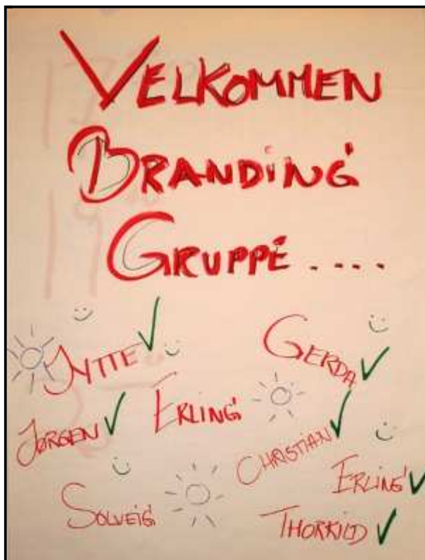
Branding – gruppen

Sønderballe Ejerlavs Beboerforening havnede i gruppen, der skulle forsøge at skabe identitet og synliggørelse omkring foreningen Haderslev Landdistrikter.