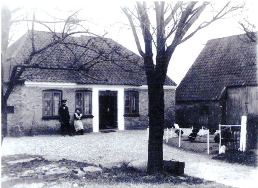
”Prøvesten” før 1907. Manden med gevær er angivelig en tysk toldkontrollør